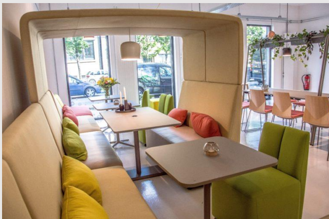
Blik in de toonzaal van Four Design