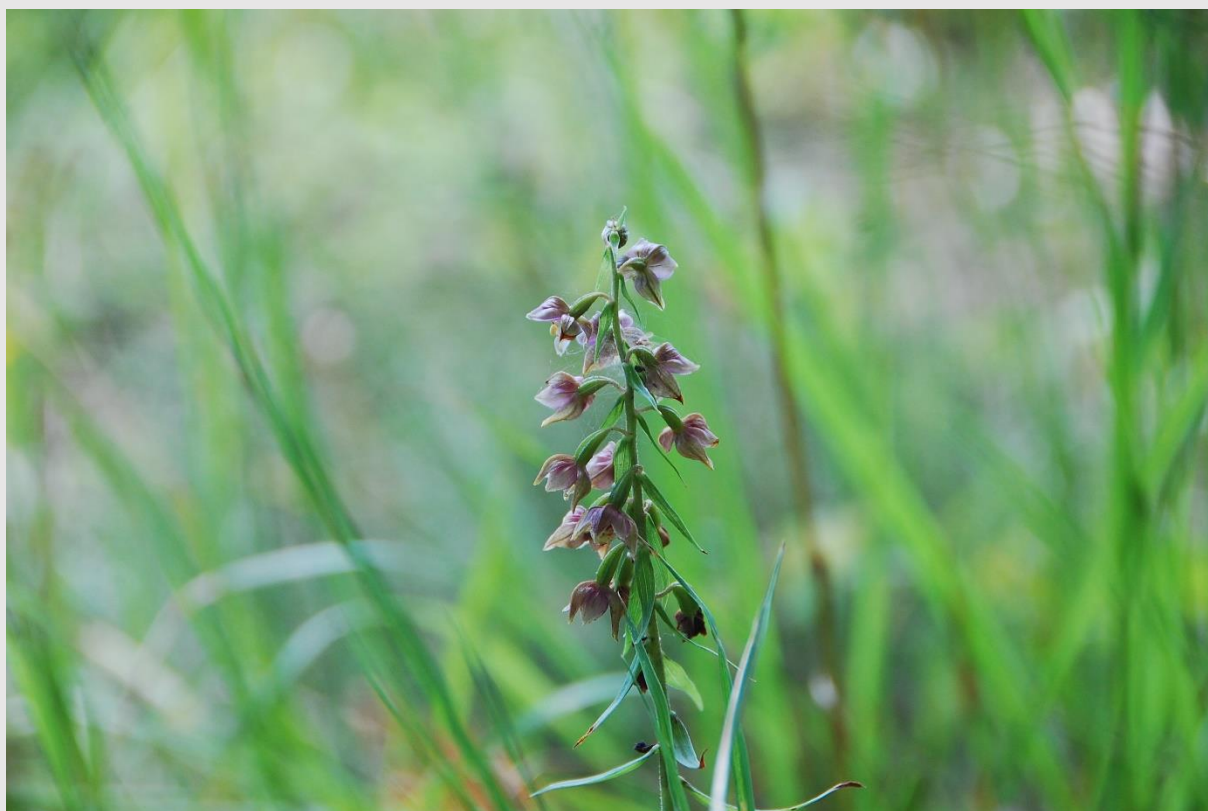
Brede wespenorchis

In dit magazine neem ik stukjes op van enkele blogberichten die voor verrassende reacties zorgden van mijn lezerspubliek.