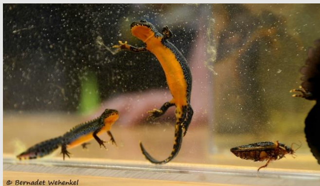
Kamsalamanders