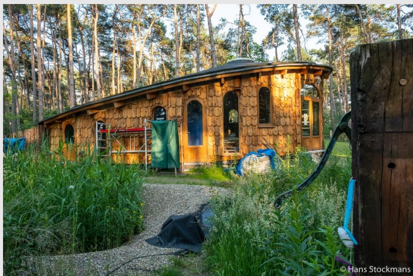
Robur vrijst te midden van bomen en bloemen.