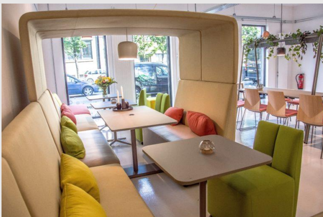
Blik in de toonzaal van Four Design