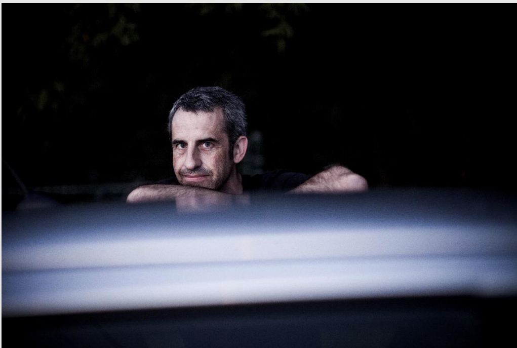
Portret